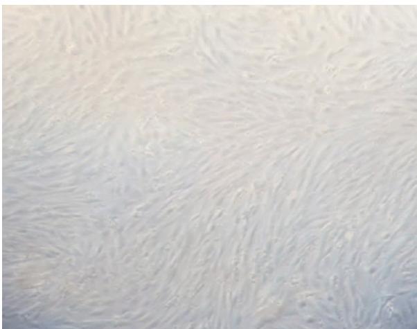
图 1 大鼠气道平滑肌细胞生长形态 Fig. 1 Growth form of rat's ASMCS

Note: A control group; B 50mg/kg group; C 400 mg/kg group. GE: glandular epithelium; LE: luminal epithelium; S: endometrial stroma. Arrow directs the positive staining nucleus of ER. The three types of cells in endometrium are positive staining (SABC)